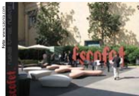
Mosaico hexagonal, ubicado en una plaza de España, creado bajo el concepto de igualdad y diversidad. Para uso en parejas o individual.

Temas como la durabilidad, su fácil reparación, rápido mantenimiento, alta resistencia, armonía estética con su entorno y especialmente, su funcionalidad, son criterios que influyen en el diseño y fabricación los productos; no en vano tienen la misión