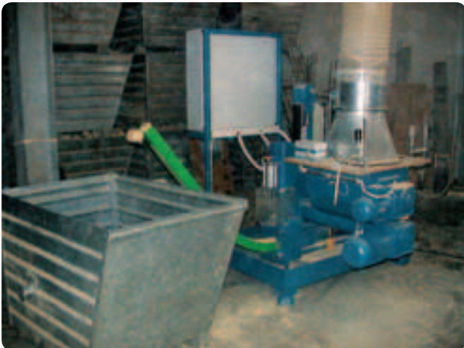
Prototipo de briqueteadora que procesa toneladas de residuos forestales.