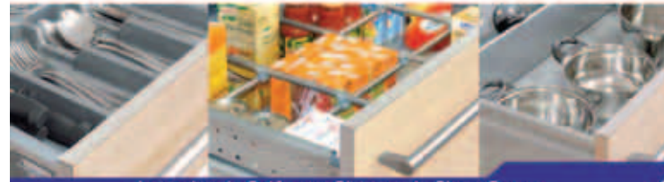
Laterales de Cajón con Sistema de Cierre Suave

En Herrajes para Muebles tenemos Todas las soluciones , con las mejores marcas