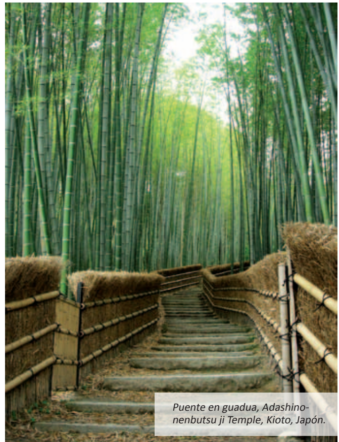
Puente en guadua, Adashino-nenbutsu ji Temple, Kioto, Japón.

No obstante la importancia y lugar que, los puentes en mención, ocupan en la historia —a razón de las técnicas desarrolladas, las soluciones ofrecidas por la ingeniería estructural, el uso de materiales como el hormigón o el acero y las consideraciones económicas que determinaron las construcciones— el hombre ha trabajado en otras obras que —con menos presupuesto e inversión— se constituyen también en soluciones efectivas; no sólo como pasos físicos de comunicación, sino como íconos arquitectónicos que integran recurso renovable e interesantes técnicas constructivas; estos son los puentes en guadua.