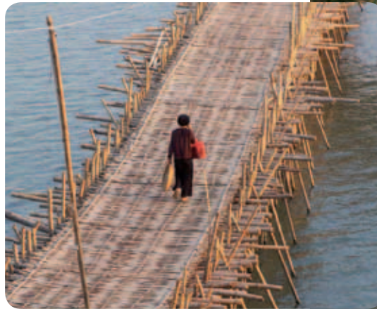
La guadua, ha sido por siglos un material natural usado por las comunidades que habitan en la franja ecuatorial de América y Asia. Puente Kampong Cham, en Cambodia.

En los últimos años, con la promoción de la arquitectura sostenible, la cual reflexiona sobre la eficiencia de la construcción en relación con el