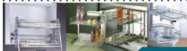
Sistemas de Almacenamiento