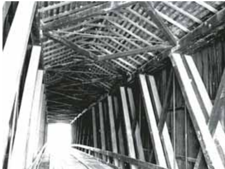
Foto 2. Cercha de doble pared enrejada "Lattice truss". Ithiel Town, USA construido en 1820 y Puente de Cercha Howe para ferrocarril, USA. 1840

Es así como en 1820 el arquitecto Ithiel Town patentó el diseño del puente de doble pared enrejada, una solución fácil de fabricar, con la cual se llegó a cubrir luces de 66 metros y que representó el primer diseño hacia la cercha así como se conoce actualmente. Con el antecedente, este sistema se convirtió rápidamente en la forma de construcción más común para los puentes cubiertos americanos, construidos para tráfico vehicular y ferroviario. (Foto 2)