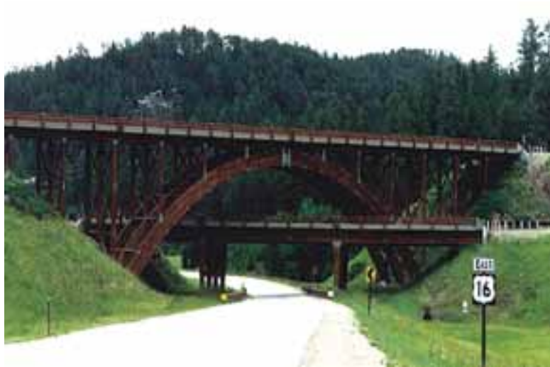
Foto 7. Puente Keystone Wye, construido en 1968, en el sur de Dakota, USA, con un largo total de 88 metros y una luz de 49 metros que vence el arco.