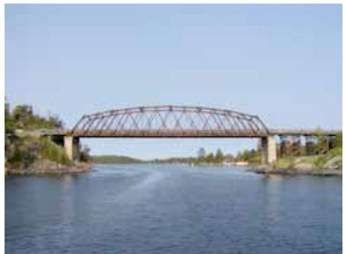
Foto 4. Puente Sioux Narrows, Ontario, construido en 1936. Su estructura es en cercha Howe, venciendo una luz de 64 metros.

En la década de los años 40, se introduce el LPE como material para la construcción de puentes y a partir de 1960, se convierte en el material por excelencia para este fin. Un ejemplo representativo de la tecnología de LPE, es el puente vehicular Keystone Wye, construido en 1968 en el sur de Dakota, utilizando la tecnología del laminado pegado para la estructura de la viga y arco principales. (Foto 7)