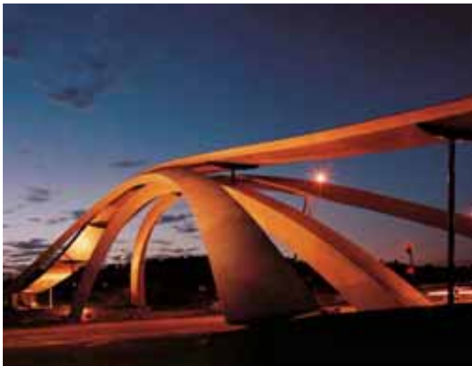
Fotos 15 y 16. Puente Leonardo, un diseño de Leonardo Da Vinci, levantado en Aldea As, (Noruega) en 2001. Armado en madera sin tratar, tiene una luz de 45 metros y un largo total de 110 metros.

La solución de esta estructura es una combinación de acero y madera, que se integra perfectamente al paisaje noruego. Está sostenido por tres arcos de LPE, un arco principal y dos laterales apoyados sobre el principal, fijados sobre dos bases de concreto piloteados y anclados al suelo rocoso. El tablero, que actúa como cubierta del puente, está fabricado en madera de abeto sin tratar y descansa en el centro sobre el arco principal y sobre cuatro columnas de acero en los extremos. La estructura alcanza los nueve metros por encima del nivel de la autopista. 🏗️