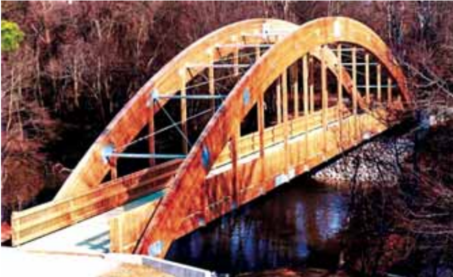
Foto 14. Puente ubicado en Tar River trail, Rocky Mount (Estado de New Cork, USA) construido en el año 2000, de 69 metros de luz, 4.25 metros de ancho y armado en madera con acabado asfaltado.