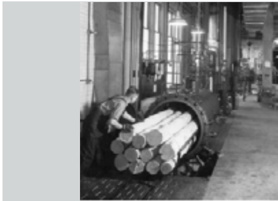
Foto 3. Cilindros de tratamientos de preservación a presión. 1934. USA.

Pero tal como se registraban constantes mejoras a nivel estructural, también se desarrollaba productos, sustancias e insumos para proteger las novedosas iniciativas. Justamente, a finales del siglo XIX, el desarrollo de tratamientos preservativos a presión significó el progreso más importante para mejorar el desempeño y asegurar la durabilidad de los puentes en madera, lo que repercutió en el perfeccionamiento los diseños y tecnologías constructivas de los puentes existentes. De igual forma, en Francia, para el mismo periodo, el coronel Emy imaginó un sistema de "vigas laminadas" unidas con pernos y correas metálicas, pero sólo hasta 1900 se reporta en Suiza el nacimiento de vigas laminadas curvas, cuando el suizo Otto Hetzer reemplaza los pernos metálicos por adhesivos naturales, probablemente caseína (3) . (Foto 3)