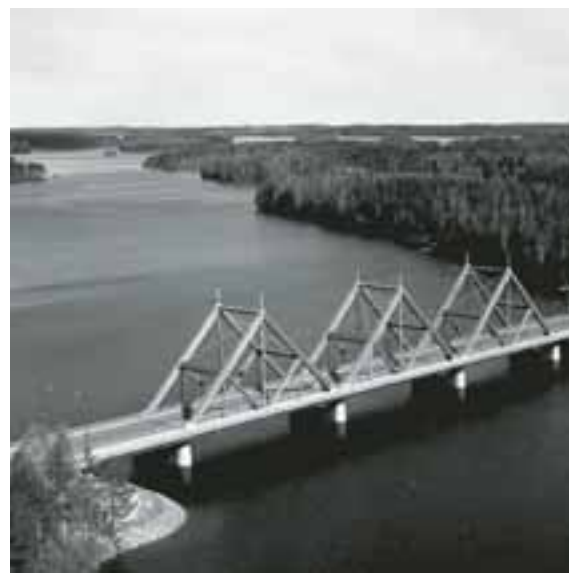
Foto 13. Puente Vibantasalmi, ubicado en Mäntybarju, Finlandia (1999), de 11 metros de ancho y de 168 metros de luz, construido con tecnología LPE. La estructura está conformada por tres cerchas Rey, donde sus dos vigas principales fueron elaboradas en LPE. Su tablero es una estructura de madera con acabado de concreto que se descuelga y es sostenido por medio de pendolones de acero en los puntos medios y cuartos de las cerchas triangulares.