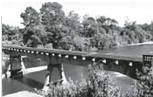
Fotos 10. Puente Teal River, Chequamegon National Forest Sawyer County, WI construido en 1989. Luz total de 9.7 metros y un ancho de 7,2 metros.

River en 1989 y recientemente, a nivel latinoamericano, en Chile se han registrado algunos experimentos con esta tecnología, relacionada con la restauración de puentes vehiculares. (Foto 10) y (Foto 11)