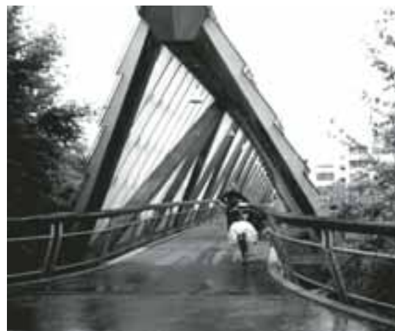
Foto 12. Puente ubicado sobre el río Neckar en Remseck (Alemania - 1988), fue construido con tecnología LPE, armado en madera tratada y espina de pescado y tiene una luz de 80 metros y 7.56 metros de ancho.

Esta innovadora construcción, con la disposición inclinada del par de vigas reticuladas (cerchas) elaboradas con tecnología de LPE, se une en su cordón superior, generando una viga tipo cajón de sección triangular. Aquí la plataforma de piso, además de unir los cordones inferiores de las dos cerchas laterales, queda protegida al interior de la viga cajón. Las dos cerchas constituyen así la cubierta revestida, con vidrios de seguridad, que le confieren su singular atractivo estético. (Foto 13 y 14)