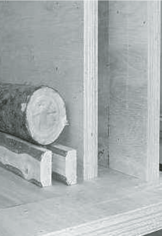
Foto 8. Manufactura de tableros de LVL

adhesivos a prueba de agua, que respetan la dirección paralela de la veta y de esta forma ofrecen un tablero compacto del que pueden obtenerse elementos a la medida exacta y necesaria para, por pegado, conformar vigas, viguetas, columnas, perfiles, etc.