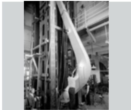
Foto 5. Pruebas llevadas a cabo en el Laboratorio de productos Forestales de USA, con arcos de madera laminada, 1935.

Con el tiempo otros importantes desarrollos hicieron su aparición, y entre los más valiosos registrados durante el siglo XX, esta la Madera Laminada Pegada Estructural LPE , consistente en la unión de tablas (láminas o llamadas también lamelas) por sus extremos que se empalman por medio de la tecnología del dentado tipo "finger joint", y unidas también por sus caras, mediante pegantes (4) , que restituye la continuidad de las fibras para lograr elementos de gran longitud (5) , a partir de vigas, arcos y marcos, conformando unidades estructurales de largos ilimitados con secciones de geometrías muy variadas. (Fotos 5 y 6)