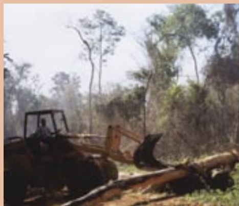
La destrucción del bosque natural con miras a los cultivos energéticos ocasionaría, además de la pérdida de la masa forestal, la fauna y la flora, una fuerte presión sobre el suelo y los recursos hídricos.