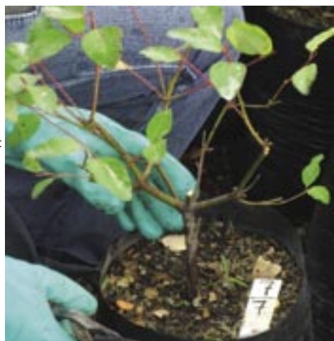
Planta madre de Eucalyptus grandis . De esta planta se cosechan estacas, que una vez enraizadas, serán copias idénticas de su progenitora.