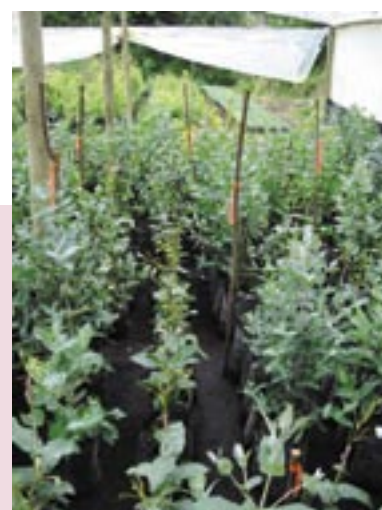
Injertos de Eucalyptus globulus en crecimiento. Al igual que otras especies de eucaliptos, alrededor del 50 por ciento de estos injertos logran sobrevivir.

De igual manera, se debe considerar que el MGF implica realizar una inversión importante en aspectos como: recurso humano calificado para el diseño de las pruebas genéticas, una colección de semillas que reúna una muestra representativa de procedencias, personal capacitado para implementar ensayos en terreno y, en fases más avanzadas, el dominio de técnicas especiales como los protocolos de cruzamientos controlados, entre otras actividades, lo que significa que un programa de reforestación a pequeña escala no admitiría, en términos de rentabilidad, una inversión de este tipo.