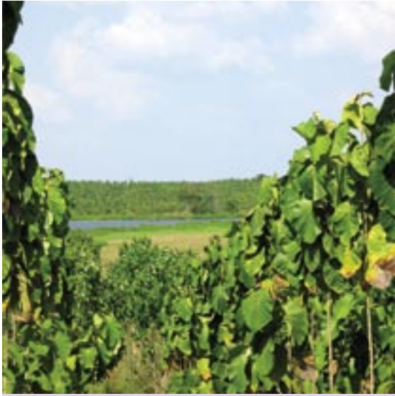
Plantaciones comerciales con Tectona grandis (Teca).

ha en Pinus maximinoii que producen 1 kg de semilla anual –del cual se derivan 20.000 plantas aproximadamente– y un huerto de tres ha de Pinus kesiya .