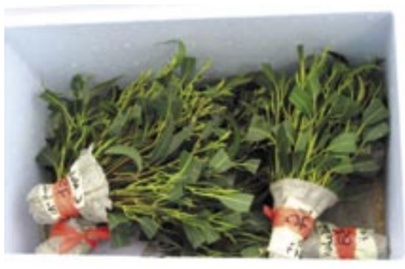
Las yemas deben ser cosechadas, identificadas y transportadas a bajas temperaturas para la injertación.

Sin embargo, en términos prácticos, para entrar en la cultura de los clones se requiere total precisión en los procesos productivos y un trabajo de selección genética exhaustiva realizada previamente; por tanto, esto solo será financieramente viable para empresas reforestadoras consolidadas y con proyecciones importantes de plantación.