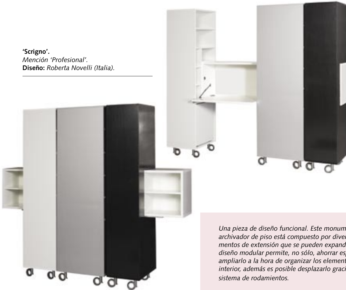
'Scrigno'. Mención 'Profesional'. Diseño: Roberta Novelli (Italia).

Una pieza de diseño funcional. Este monumental archivador de piso está compuesto por diversos elementos de extensión que se pueden expandir y cuyo diseño modular permite, no sólo, ahorrar espacio sino ampliarlo a la hora de organizar los elementos en su interior, además es posible desplazarlo gracias a su sistema de rodamientos.