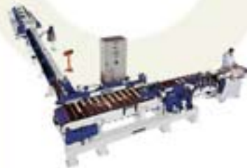
FINGER JOINT OPTIMIZADORAS