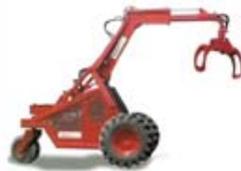
TRACTOR FORETAL GRUAS FORESTALES